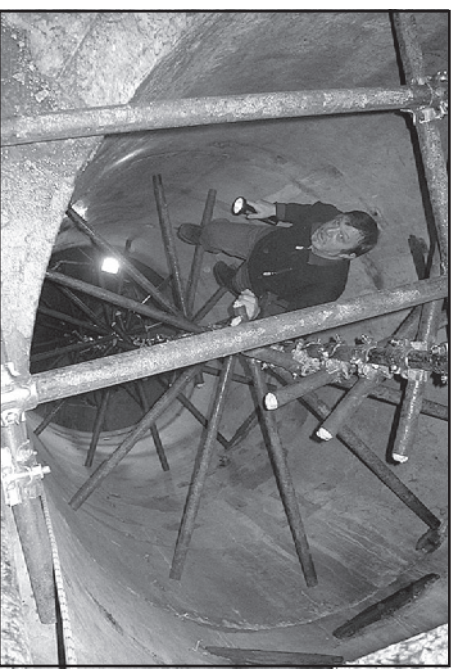
Το ενονομαζόμενο "πηγάδι Globocnik".

Δεν βρισκομε ιχνός μιας προσταθείας εισόδης, από μερους των Γουκοσλάβιων φανταρών, στον υποτελιο διαδρομής συνδεσης με το Δικαστήριο, πιθανόν κανενας δεν ήξερε για αυτό το περσασμα. Ο αγώνας στην πόλη ήταν συντομος, οι γεωμετροί φανταροι παραδοθηκαν στα νεοζηλανδεζικα στρατεύματα, που εντομητάξυ είχαν μπει στη Τερπεστη. Τελείωνε μετά από εικοσι μηνες η κατάληψη της περποχης από μερους του γεωμετρικού στρατού.