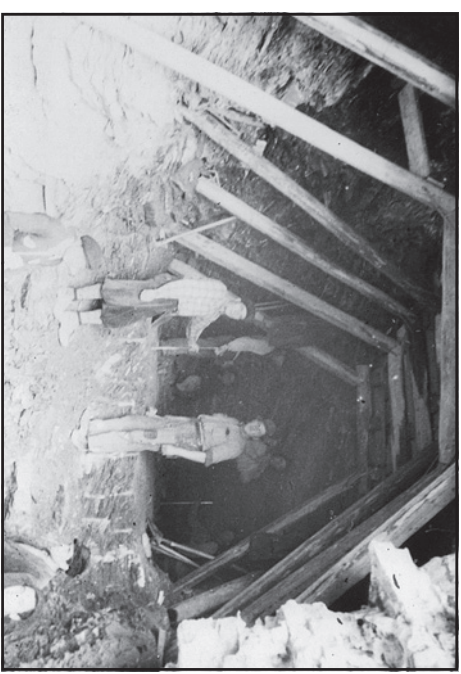
5.2.1943 - Οδός F. Severo. Υπογειος διάδρομος συνεχής της δημοτικής στας.